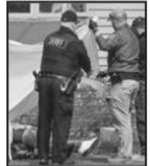
AYER SE REGISTRARON DOS TIROTEOS EN EUA CON 4 MUERTOS.

En la mayor parte de los casos, los accidentes se deben a errores humanos así como a la falta de sistemas de señalización y de seguridad.