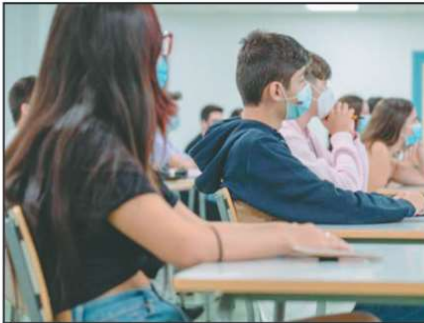
TRAS UN AÑO DE SUSPENSIÓN DEBIDO A LA PANDEMIA, CAMPECHE REGRESA HOY A LAS CLASES PRESENCIALES.

maestros que regresarán a dar clase en persona.