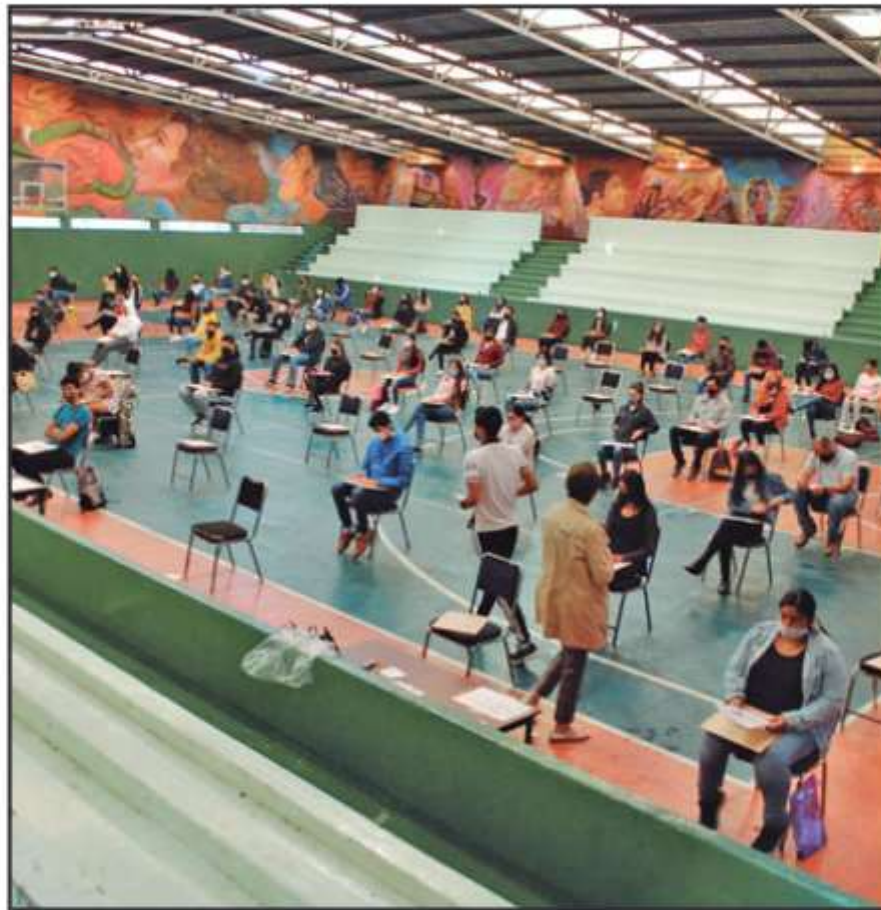
EL AÑO PASADO, CIENTOS DE ALUMNOS OBTUVIERON CALIFICACIONES CASI PERFECTAS; PRUEBA SE REPITIÓ.

Es importante señalar que la Organización de Normales oficiales del Estado de Michoacán