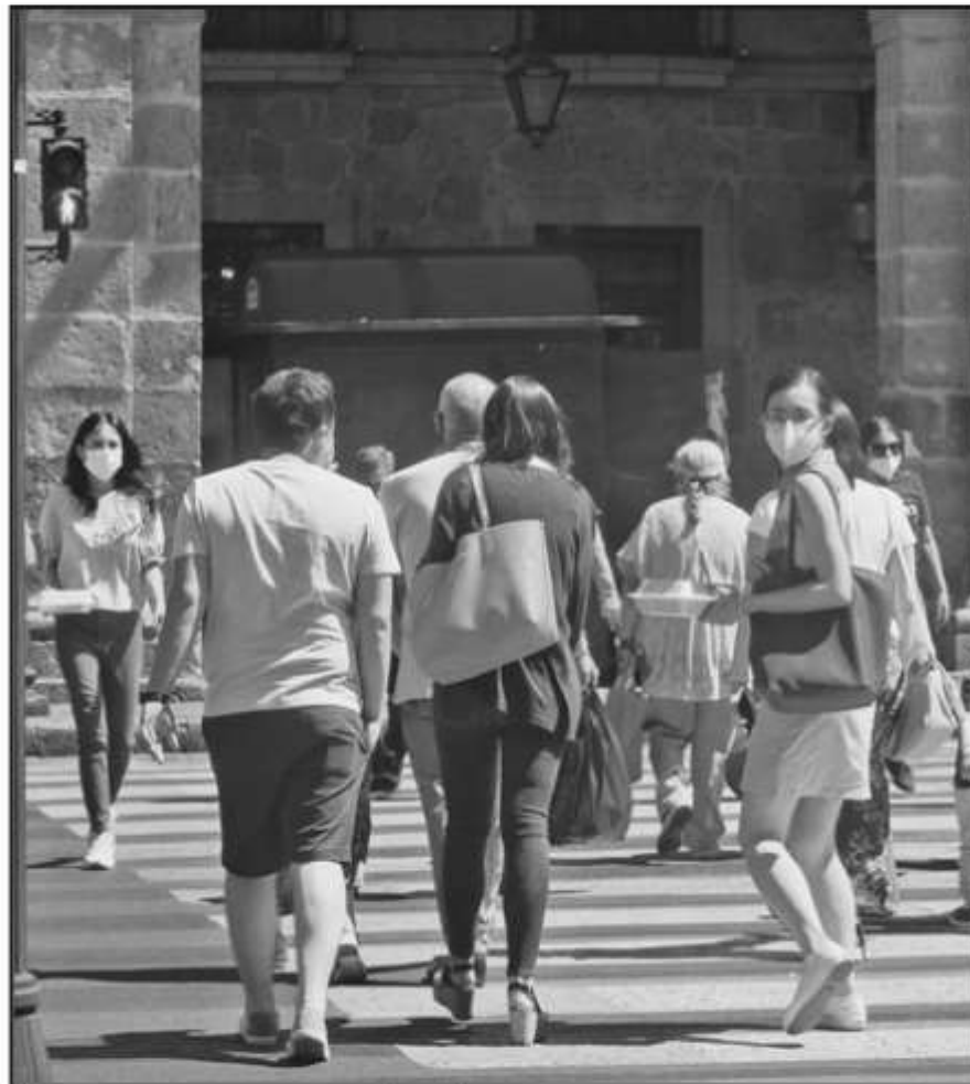
LA TENDENCIA DE CONTAGIOS EN MICHOACÁN PODRÍA ALCANZAR HASTA MIL 500 DECESOS PARA EL MES PRÓXIMO.

Para inicios de abril, la capital michoacana ya presentaba un acumulado de mil 359 muertes por esta causa, lo cual refleja un aumento de más de 300 casos en un periodo de unos 45 días. Adicionalmente, del cuatro al 18 de abril, se adicionaron 52 nuevos fallecimientos en dos semanas.