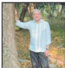
EN UN VIDEO, AMLO PIDE A ELI DAR EMPLEO A MIGRANTES.

Ciudad de México.- El presidente Andrés Manuel López Obrador propondrá a su homólogo de Estados Unidos, Joe Biden, un acuerdo de ordenamiento migratorio con los países centroamericanos para facilitar visas de trabajo, a partir de la ampliación del programa “Sembrando Vida”.