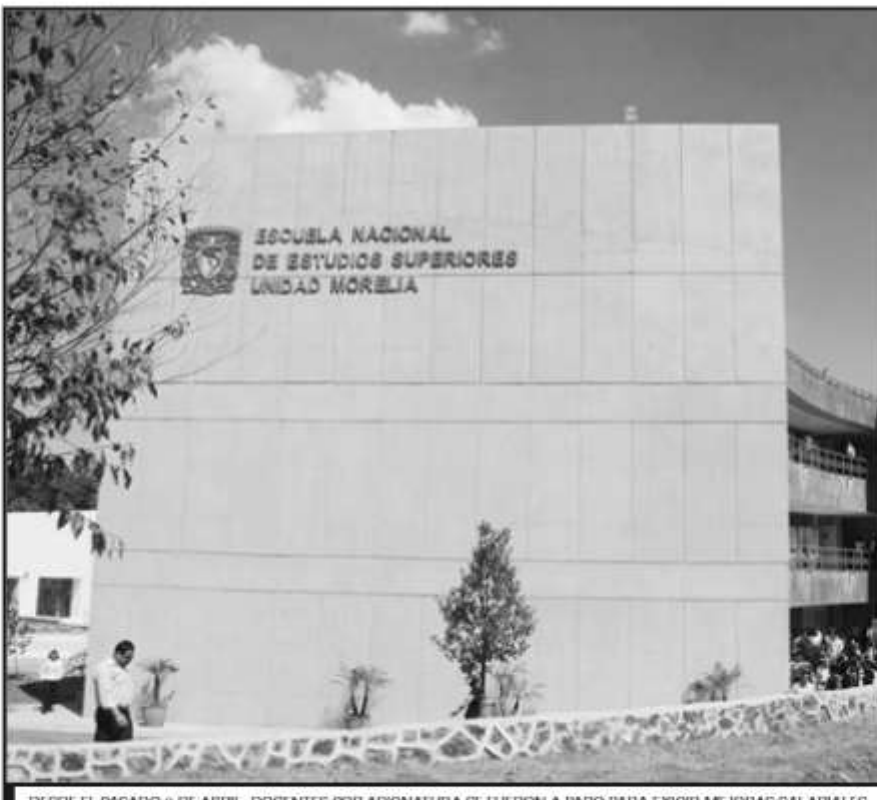
DESDE EL PASADO 9 DE ABRIL, DOCENTES POR ASIGNATURA SE FUERON A PARO PARA EXIGIR MEJORAS SALARIALES.

Finalmente, piden reconocimiento y al desarrollo profesional extra académico, pertinente a cada área, ya que el informe docente semestral no contempla las particularidades de otras áreas fuera de la investigación.