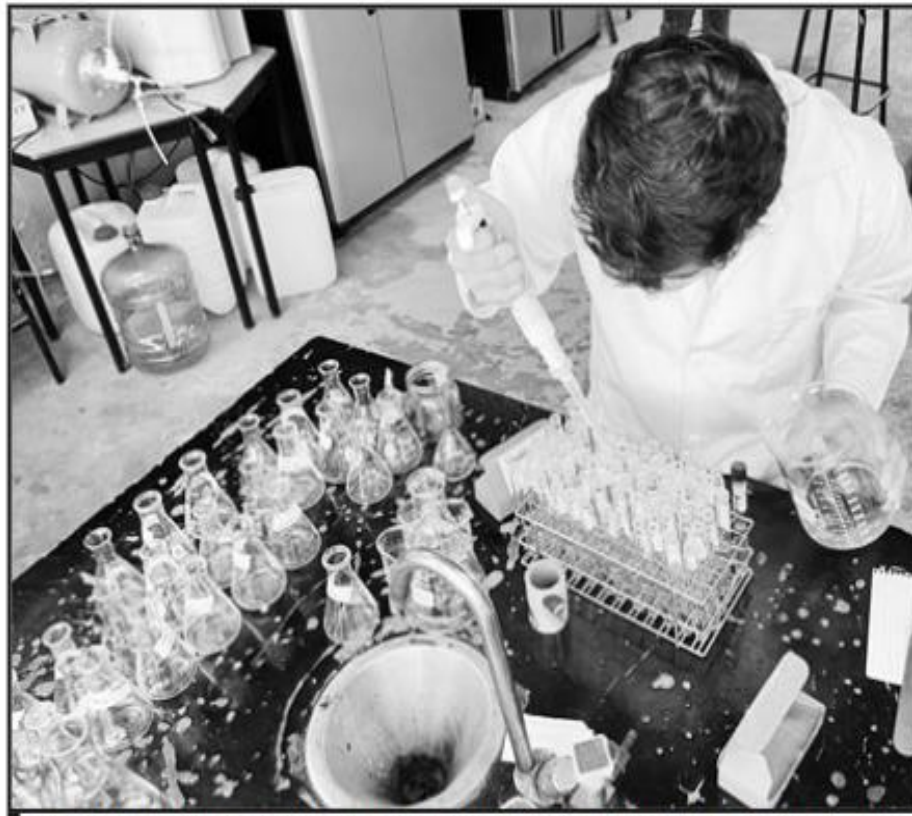
RECTORA MANIFESTÓ QUE CON ESTE LOGRO PRESUPUESTA SE AVANZA EN MEJORAR LAS CONDICIONES DE LA UTM.

Por otro lado, se impulsará el desarrollo de la Ingeniería en Biotecnología, con 4 millones 615 mil