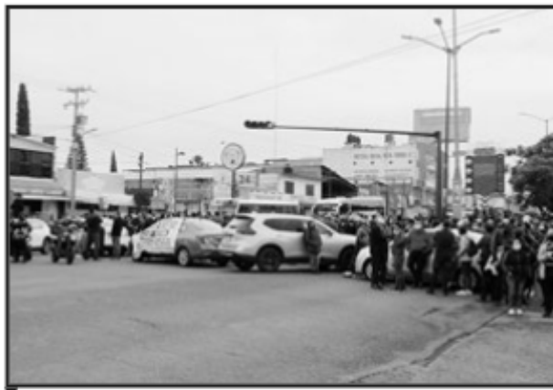
ANTE EL BALANCE NEGATIVO EN LOS ACUERDOS Y COMPROMISOS DEL FESEMSS Y EL GOBIERNO DEL ESTADO, ANUNCIAN QUE SOSTENDRÁN MOVILIZACIONES.

Asimismo, expuso que los gremios han tenido consideraciones y han mostrado buena voluntad al gobierno entrante, "no afectamos las clases, aun en el