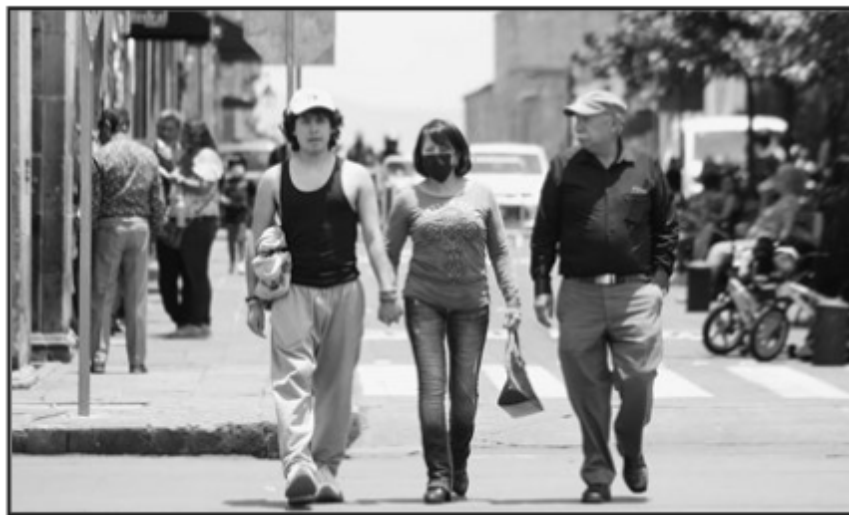
PESE AL AUMENTO DE CONTAGIOS MUCHAS PERSONAS HAN DEJADO ATRAS LAS MEDIDAS SANITARIAS.

Morelia se mantiene como la demarcación con más personas contagiadas, y este domingo sumó 239, con los cuales suma 8 mil 180 casos confirmados en julio, y de ellos 3 mil 927 son casos activos. El resto de los municipios van de uno a 24 nuevos contagios, por lo que la capital del estado es el epicentro actual de la ola de la pandemia.