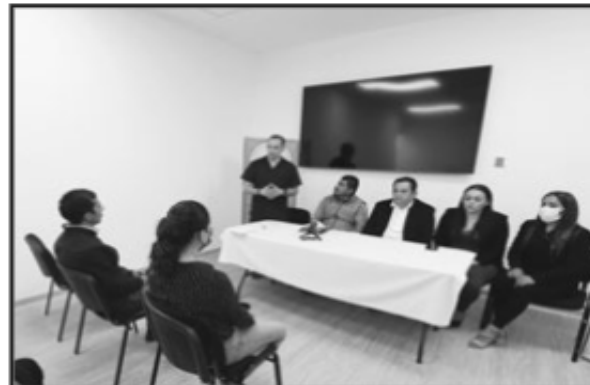
LA ASOCIACIÓN CIVIL UNINI UNTANI, LA CDPI, EL AYUNTAMIENTO DE ERONGARICUARO Y EL HOSPITAL ÁNGELES INICIARON JORNADA DE CIRUGÍAS.

Es decir, la primera osteotomía correctiva se trataba de una fractura ya consolidada por el tiempo en el húmero (hueso más largo de la extremidad superior) de un niño, que había fijado en forma negativa y provocaba poca funcionalidad en la extremidad y anti estética del brazo.