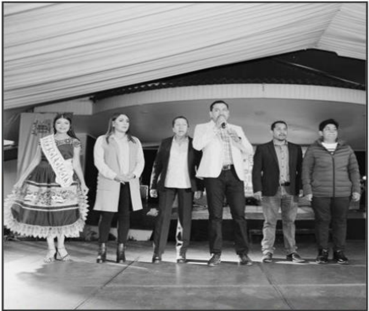
DURANTE SU MENSAJE, EL PRESIDENTE MUNICIPIO TAMBIÉN AGRADECIÓ LA CONFIANZA DEPOSITADA DE LOS VECINOS.

Durante su mensaje, respecto a este evento, el cual se realizó en el Teatro del Pueblo, aseguró que este año más de 20 mil personas disfrutaron, durante 8 días, de un espacio digno para celebrar la tradicional fiesta en honor a Santiago Apóstol. "Me da mucho gusto estar aquí, sin ustedes la Expo Feria Chilchota 2022 no hubiese llegado a su máximo esplendor. Gracias a todos los vecinos de Chilchota por confiar en mí", señaló el Alcalde. Además, el Edil, destacó que el Teatro del