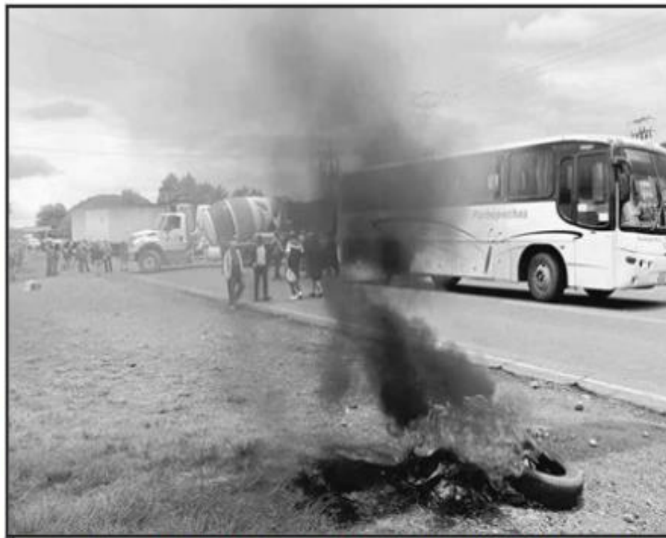
ANTE LA LESIÓN CAUSADA POR UN AUTOBÚS, LOS NORMALISTAS PIDEN CASTIGO A LA EMPRESA RESPONSABLE.

Luego de dar el mensaje a los pasajeros y pasar el bote por los asientos, se disponían a bajar cuando, según su versión, el chofer arrancó la unidad de forma violenta, por lo que los estudiantes que aún no descendían fueron expulsados del camión.